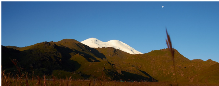
Elbrus, einer der 7 Summit, von der Nordseite.

...zumindest in Afrika war es größtenteils sommerlich, wurden alle Touren zu und auf den Kilimandscharo und Mount Kenia von Erfolg gekrönt. Im Karakorum, Pakistan, hatten wir zeitgleich die „Wahnsinns-Saison“ mit stabilen guten Wetter im Juli und Anfang August. An einem perfekten nahezu windstillen und äußerst warmen 23.08. glückte unserem Team (alle am „Rocky Summit“ und zu 80% auf dem Hauptgipfel) die Besteigung des Broad Peak (8050m) .